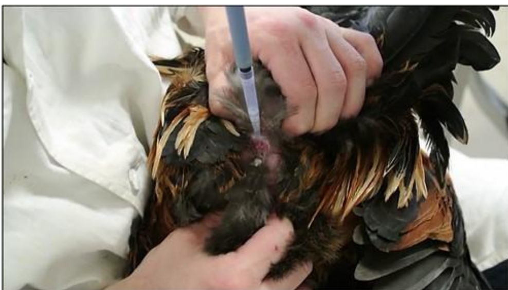
Obrázek 1: Odběr ejakulátu

Ejakulát kohoutů se získává technikou dorzo-abdominální masáže (Burrows et Quinn 1935) a nevyžaduje stimulační přítomnost samic, jako je tomu u savců. Osoba provádějící odběr drží kohouta za běháky a současně fixuje jeho hlavu v podpaží. Dorzo-abdominální masáž je prováděna obvykle pravou rukou (u praváků) směrem od hrudní kosti ke kloace. Poté se těsně před ejakulací stiskne kloaka pro vychlípění kopulační papily. Přítomný technik provede sběr ejakulátu do sběrné nádoby. Vzhledem k malému objemu ejakulátu lze odběr realizovat také pomocí laboratorní pipety (viz Obrázek 1). Délka odběru trvá do 20 sekund. Rutinní osvojení této techniky je nezbytné. Neodbornou manipulací při odběru může dojít k výskytu příměsí krve v ejakulátu. Odběr semene by měl být prováděn vždy stejnou osobou ve stejnou denní dobu optimálně dvakrát za týden (Lin et al. 2021).