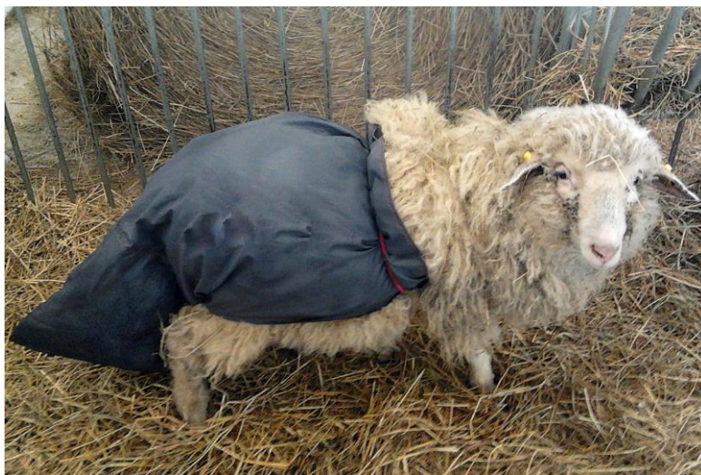
obr. 3. Vak pro získávání výkalů (výroba a foto M. Kudrnáčová)