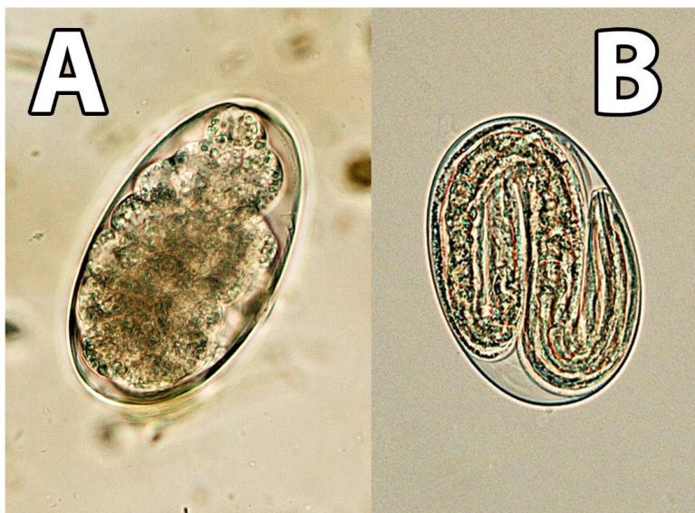
obr. 4. Vajíčka Haemonchus contortus v různém stadiu vývoje, A – embryonované vajíčko vhodné pro EHT, B – vajíčko s vyvinutou larvou, které je pro EHT nevhodné, zvětšení 400×

Pro vlastní testování je vhodné použít 24 jamkovou kultivační destičku pro tkáňové kultury. Jako pozitivní kontrola slouží anthelmintikum – 1% thiabendazol (kvalita farmaceutického standardu), negativní kontrolou je dimethylsulfoxid (DMSO) v kvalitě analytického standardu. Na základě vlastního pozorování lze doporučit koncentraci 0,5 – 1 % DMSO. Při koncentraci vyšší než 3 % pak dochází k negativnímu ovlivnění líhivosti vajíček (viz tab. 2). Ethanolvý extrakt z testované rostliny je aplikován do jamek kultivační destičky ve vzrůstající řadě koncentrací. Na základě vlastní zkušenosti můžeme doporučit 4× ředění k dosažení nejvyšší koncentrace 1 024 \mu\text{g}\cdot\text{ml}^{-1} . Testování vyšších koncentrací