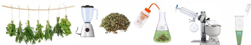
obr. 2. Schematické znázornění přípravy rostlinného extraktu (originál J. Vadlejš)