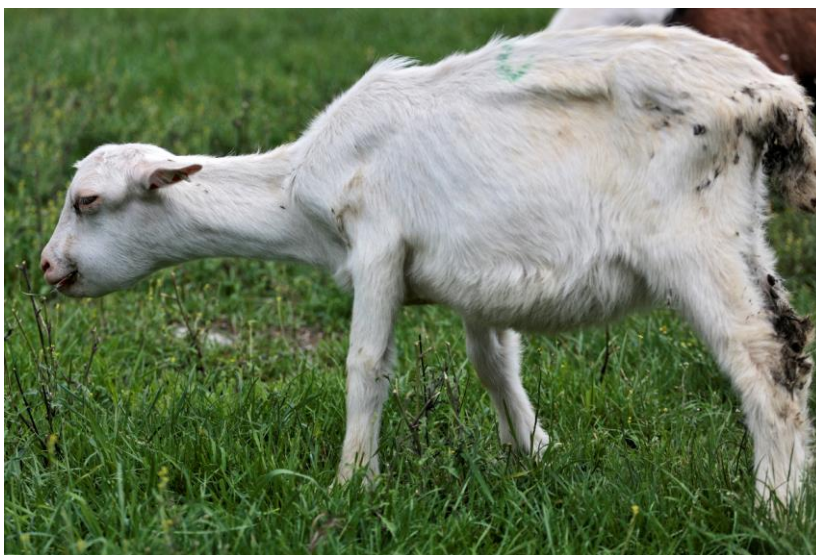
obr. 1. Kůzle trpící těžkou parazitární gastroenteritidou

nechutenství, zažívacím obtížím až průjmům a v důsledku toho k hubnutí a zhoršení kondice (viz obr. 1). Ve většině případů se tedy nejedná o život ohrožující onemocnění, ale může výrazně ovlivnit ekonomiku chovu. Přímé ztráty v důsledku PGE se projevují sníženou produkcí a kvalitou produktů, ty nepřímé jsou pak spojeny s nárůstem nákladů na diagnostiku a terapii (Hoste et al., 2011a; Charlier et al., 2015).