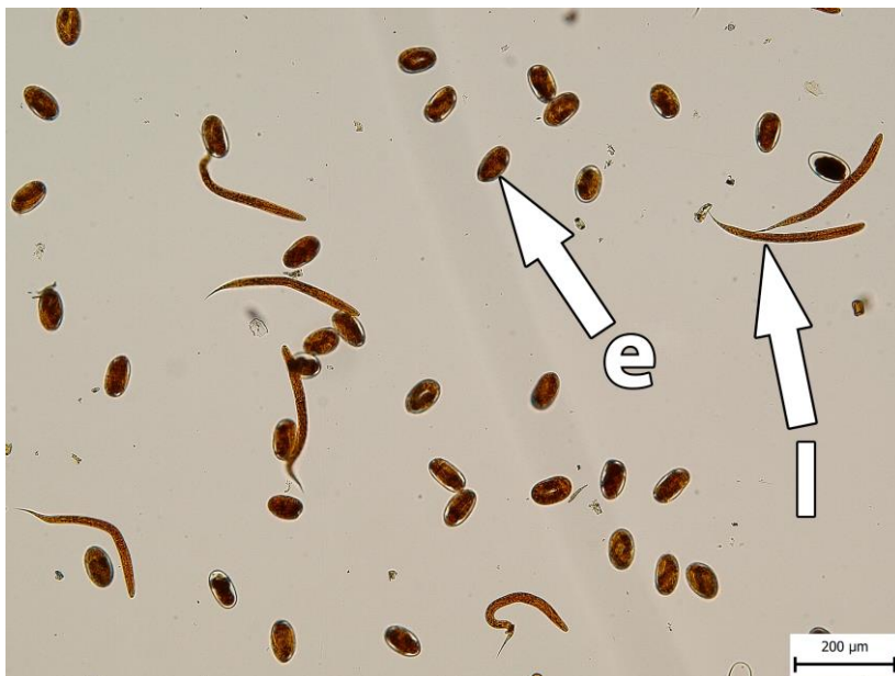
obr. 5. Výsledek testu líhnutí vajíček (EHT), vajíčka v různých fázích vývoje (e) a larvy 1. vývojového stadia (l) Haemonchus contortus , zvětšení 100×