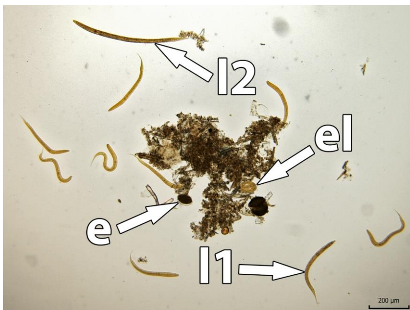
obr. 6. Výsledek testu vývoje larev (LDT), nevyvinuté vajíčko (e), vajíčko s vyvinutou larvou (el), larva 1. vývojového stadia (I1) a larva 2. vývojového stadia (I2) Haemonchus contortus , zvětšení 100×