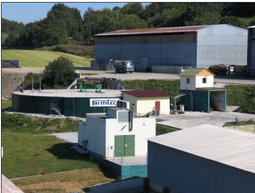
Obr. 2. BPS ZD Krásná Hora nad Vltavou

výstupů ze zemědělských BPS, tj. digestátů, separátů a fugátů, s následnou analyticky podloženou kontrolou dat získaných těmito metodami z materiálů konkrétních zemědělských BPS.