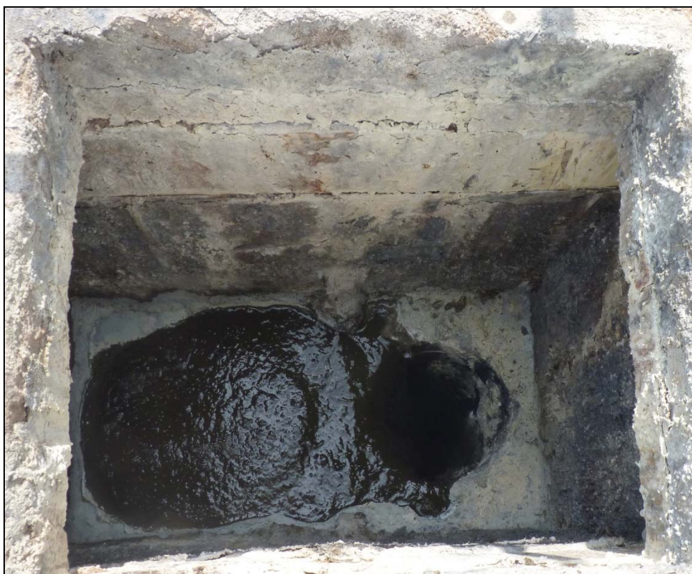
Obr. 1. Digestát vytékající z fermentoru v BPS Krásná Hora nad Vltavou

V roce 2005 bylo v České republice v provozu sto třicet tři BPS - z tohoto počtu pouze osm bylo zemědělských, osmdesát dvě byly provozovány na čistírnách odpadních vod, třicet čtyři využívaly skládkový plyn a devět stanic bylo průmyslových. V současnosti v České republice pracuje pět set BPS – z tohoto počtu je více než tři sta BPS provozováno zemědělskými podniky. Celkový instalovaný výkon činí 393 MW, roční produkce elektrické energie dosahuje cca 2200 GWh.