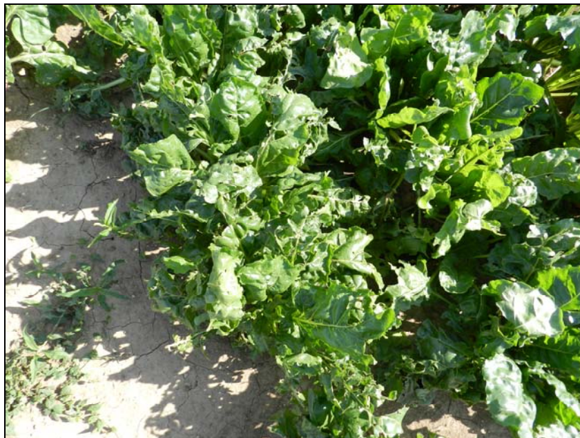
Obrázek 6. Pokusné pozemky s cukrovou řepou na stanici v Červeném Újezdě

I další sledované charakteristiky cukrové řepy potvrdily kladné působení popela ze slámy (tab. 19) a jeho výraznější účinek ve srovnání s popelem ze spalování dřevní štěpky. Celkově je možno konstatovat, že aplikace popelů neprokázala negativní reakci a to jak v případě vzcházení a růstu rostlin, tak i při hodnocení kvalitativních parametrů bulev cukrovky.