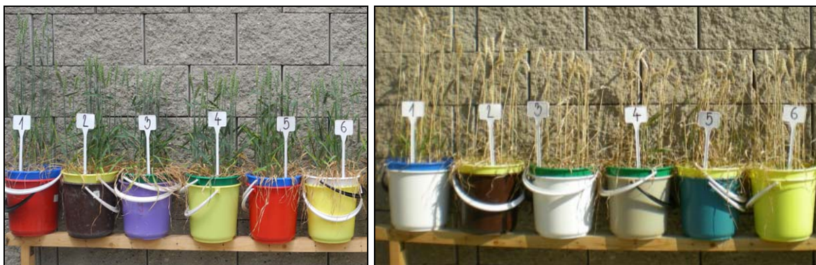
Obrázek 2 a 3. Rostliny pšenice jarní ve fázi kvetení a před sklizní

Na obrázku 2 vidíme všech 6 sledovaných variant. Nejvyšší vzrůst v tomto případě byl patrný u I. varianty, což byla nehnojená kontrola. Varianty II., III., IV., V. a VI. se vyznačovaly relativně podobným růstem. I přesto, že např. u varianty IV. a VI. byla aplikovaná dvojnásobná dávka popela, na růst to nemělo významný vliv.