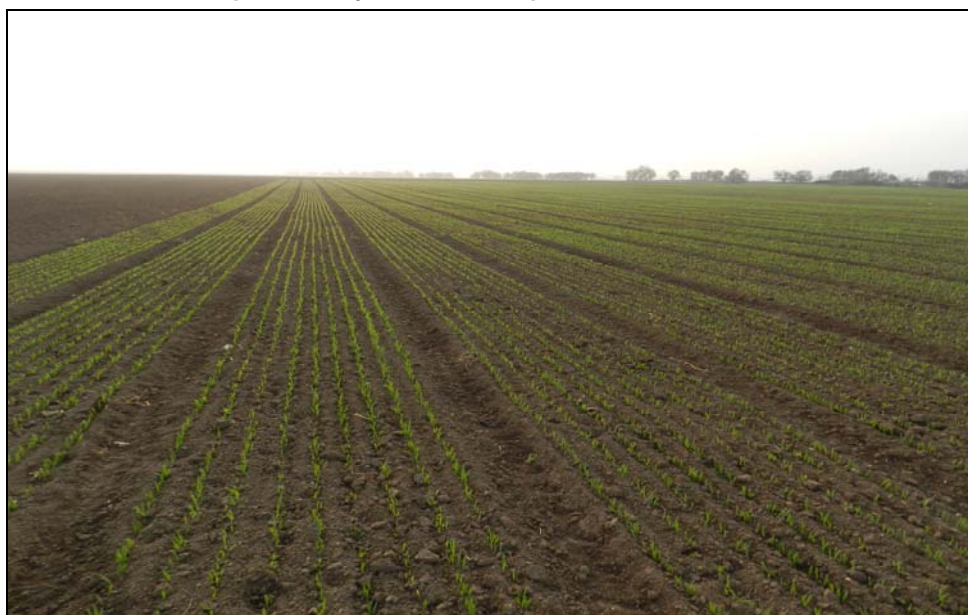
Obrázek 4, 5. Pokusné pozemky s ozimou pšenicí na stanici v Červeném Újezdě

Obsahy živin v pšenici ozimé se ve většině případů v obohacených variantách zvýšily, zejména u mobilního draslíku (tab. 15). Nejvyšší nárůst obsahu živin, s výjimkou fosforu, byl zaznamenán u varianty s nižší dávkou popele ze spalování slámy. Fosfor ovlivnila nejpříznivěji nižší testovaná dávka popele ze spalování dřevní štěpky.