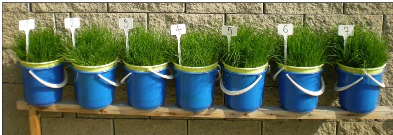
Obrázek 1. Pokusné nádoby jílku vytrvalého v jednotlivých variantách

V I. variantě byla pouze zemina bez příměsí popela a sloužila nám jako varianta kontrolní. Jako pokusná zemina byla zvolena kambizem z oblasti Humpolce, neboť tento půdní typ je v České republice zastoupen nejhojněji, a navíc hodnota pH této zeminy je nízká (pH 5), a proto by mohla být pro aplikaci zásaditého popela vhodná. Všechny varianty byly při založení a po 1 a 2. seči přihnojeny 0,5 g N/nádobu ve formě \text{NH}_4\text{NO}_3 .