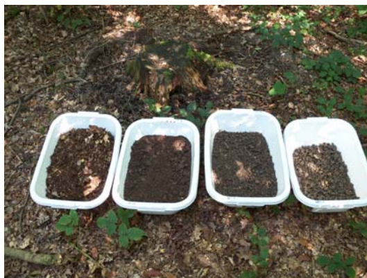
Obrázek 1. Ukázka vzorků z jednotlivých horizontů půdního profilu

Přeprava vzorků: Vzorky jsou z lokality dopraveny do laboratoře v technologicky nejkratším možném čase (obvykle do 24 hodin).